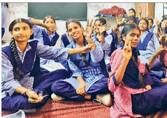
अंबाला। स्कूली छात्राएं हाथों पर मेहेंदी लगाकर वोट मेरा अधिकार का संदेश देती हुईं।

मतदान के महत्व का संदेश दिया जा रहा है। रंगोली, मेहेंदी और पेंटिंग प्रतियोगिताओं के माध्यम से मतदान के प्रति जागरूकता फैलाने का अनूठा प्रयास किया जा रहा है। इन प्रतियोगिताओं में छात्र अपनी कला के जरिए लोकतंत्र के महत्व को दर्शा रहे हैं जिससे यह संदेश जन-जन तक प्रभावी ढंग से पहुंच रहा है। कैंपस एंबेसडर की भूमिका भी इस अभियान में बेहद महत्वपूर्ण है। युवा एंबेसडर विद्यालयों और आसपास के क्षेत्रों में महिलाओं और युवाओं को मतदान के प्रति शिक्षित और जागरूक कर रहे हैं। विशेष रूप से युवा लड़कियों, गृहिणियों और कारखानों व लघु उद्योगों में कार्यरत महिलाओं को लक्षित कर उन्हें मतदान के अधिकार और उसकी शक्ति के बारे में बताया जा रहा है। यह पहल महिलाओं की भागीदारी बढ़ाने की दिशा में एक मजबूत कदम साबित हो रही है। सोशल मीडिया