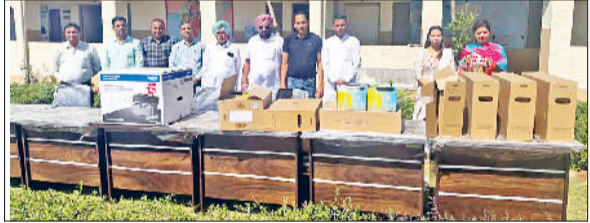
शहजादपुर। जरूरी सामान उपलब्ध करवाती जप सदस्य।